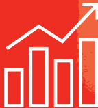
زيادة تكاليف التأمين